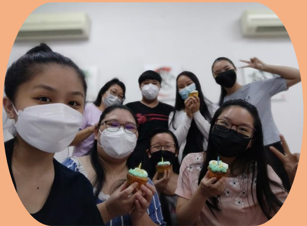
兒童和青少年活動