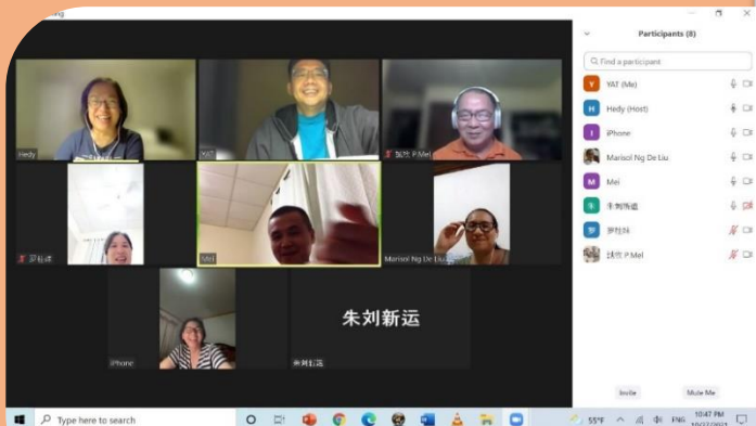
• Hedy 帶領雅歌書